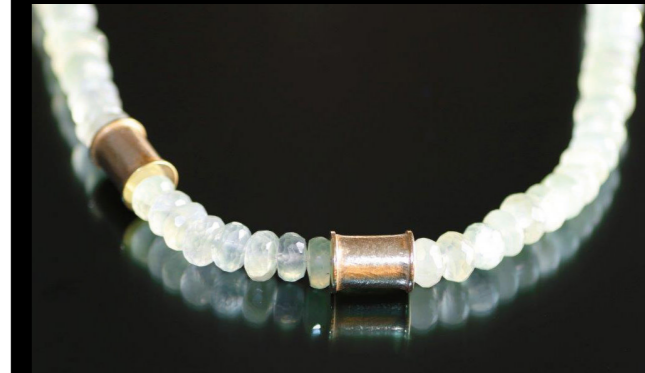
Prehnit-Kette mit Zwischenteilen in 750/- Gelbgold

Die höchste Form der Individualität ist die Kreativität.