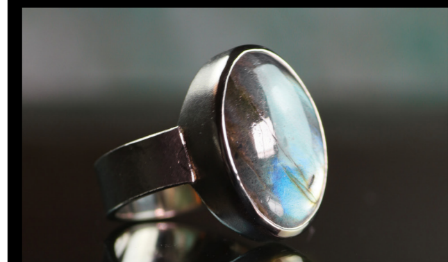
Ring in 750/- Weißgold mit Labradorith

Nordersteinstraße 12 · Cuxhaven · Tel. 04721/714267 Mo. – Fr. 10 – 18 Uhr · Sa. 10 – 14 Uhr