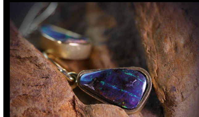
Ohringe in 750/- Gelbgold mit Opalen